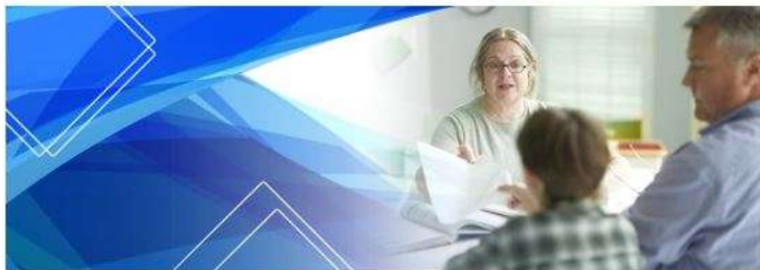
Кафедра дополнительного образования и сопровождения детства