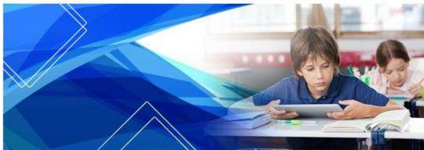
Кафедра естественнонаучных дисциплин