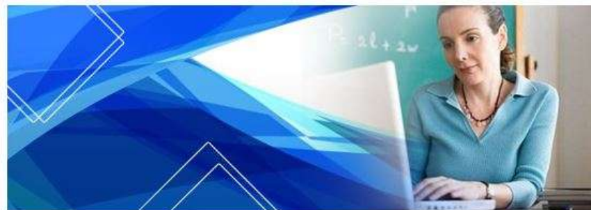
Кафедра математических дисциплин